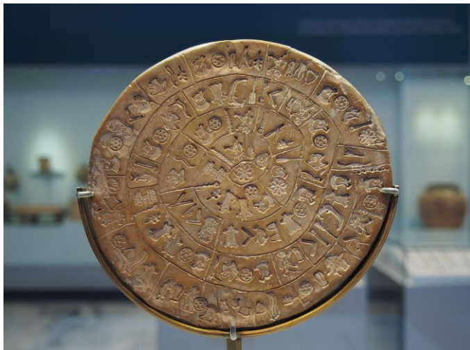
Phaistios Disk, et eksempel på tidlig datalagring.

Rapport fra arbeidsgruppen «Lagring og deling av forskningsdata» ved Universitetet i Oslo (UiO) 11.05.2015